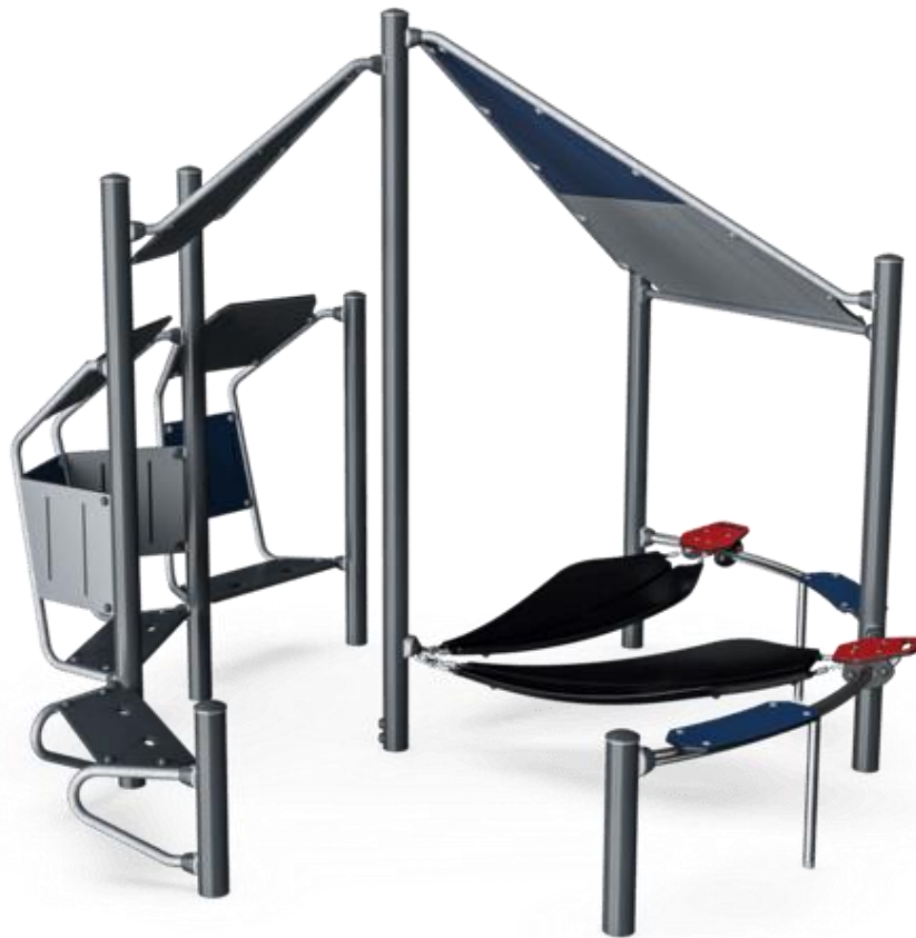
Treffpunkt mit Hängematten