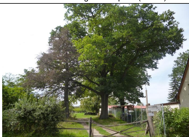
Bild 12: geschützter Altbaumbestand (Stieleiche, StD = 1,20 m und Blutbuche, StD = 0,60 m) an der Grundstückszufahrt im Nordostteil des Areals – Bedeutung als Nistplatz für Brutvögel