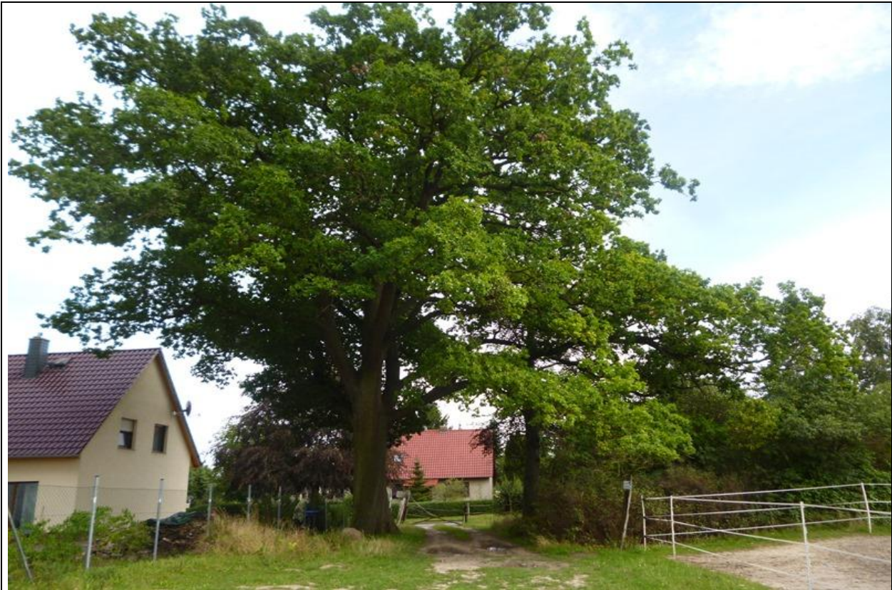
Bild 17: Erhalt der alten Stieleiche am Nordostrand des Plangebietes; Anbringen von Nistkästen für höhlenbrütende Vögel und Fledermäuse

Hinsichtlich des Verbotstatbestands „Störung“ besteht unter Berücksichtigung der Fluchtdistanzen für gehölz- bzw. höhlenbrütende Arten auch während des Baubetriebes die Möglichkeit, in ausreichender Entfernung zum Vorhabenstandort ein Nest zu bauen. Das bauzeitliche Störpotenzial ist auf einen begrenzten Zeitraum beschränkt, was in Anbetracht der vorhandenen Ersatzhabitate keine nachhaltige existenzgefährdende Störung für die gering spezialisierten Arten darstellt. Ein Fortbestand der lokalen Populationen und eine Wiederansiedlung der Arten in den künftigen Hausgärten nach Abschluss der Baumaßnahmen sind gewährleistet.