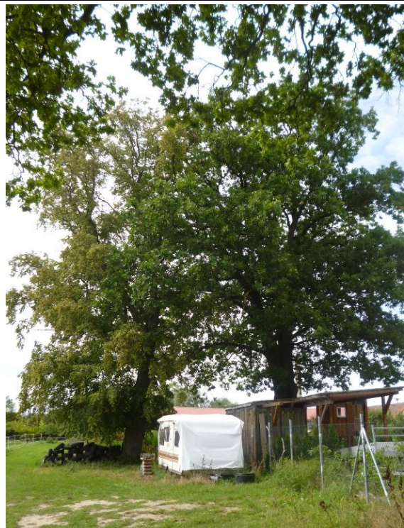
Bilder 15 und 16: geschädigte Winterlinde (StD = 1,0 m) mit viel Totholz in der Krone – Fällung geplant; Nistpotenzial für Fledermäuse und Höhlenbrüter; Erhalt der Eiche auf dem Nachbargrundstück