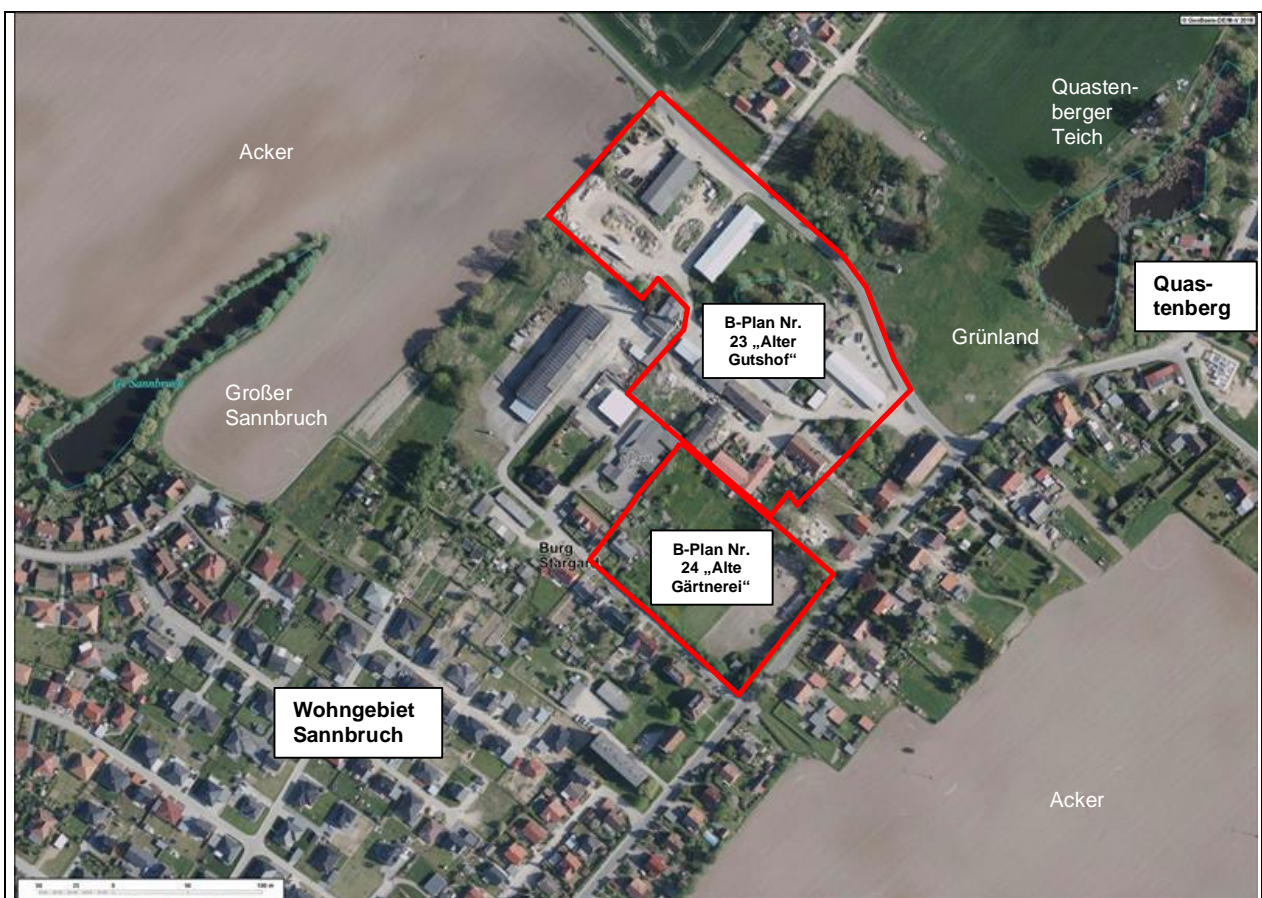
Abb. 1: Lage der Vorhabenstandorte B-Plan Nr. 24 „Alte Gärtnerei“ und nördlich angrenzend B-Plan Nr. 23 „Alter Gutshof Quastenberg“ im Naturraum

Aufgrund der Projektierung des Wohnstandortes im städtebaulichen Innenbereich beschränkt sich die Eingriffsermittlung auf die Erfassung und Bewertung des zu beseitigenden nach § 18 NatSchAG M-V geschützten Baumbestandes. Darüber hinaus werden anhand einer Potenzialabschätzung des Artenbestandes vor Ort artenschutzrechtliche Belange nach § 44 BNatSchG näher betrachtet und Vermeidungs- und Minderungsmaßnahmen definiert.