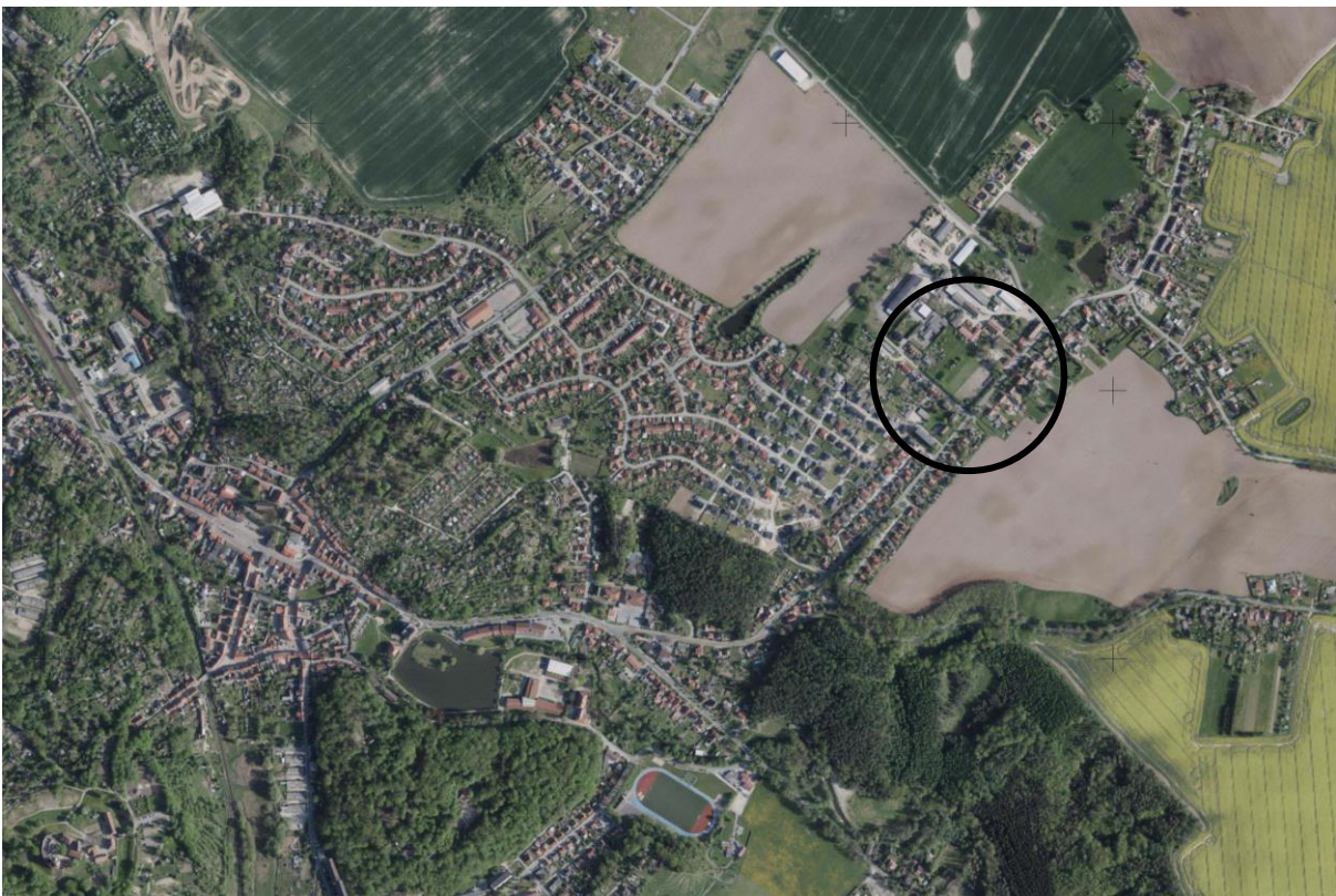
Abbildung 1: Lage des Vorhabengebiets im Stadtgebiet

Es wird ausgehend von der Straße Quastenberg erschlossen.