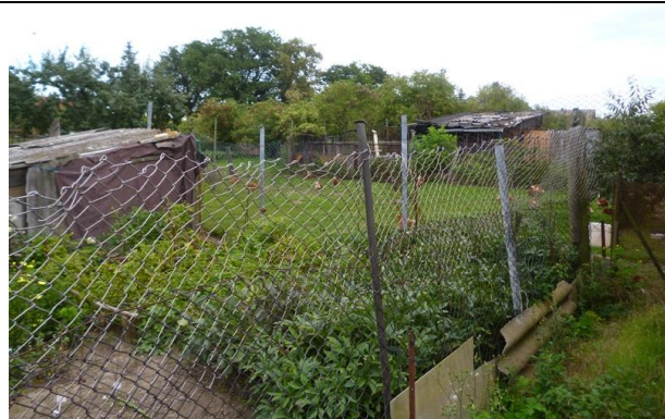
Bild 5: Gartenland mit Holzschuppen u. extensiver Hühnerhaltung im Westteil d. Plangebiets