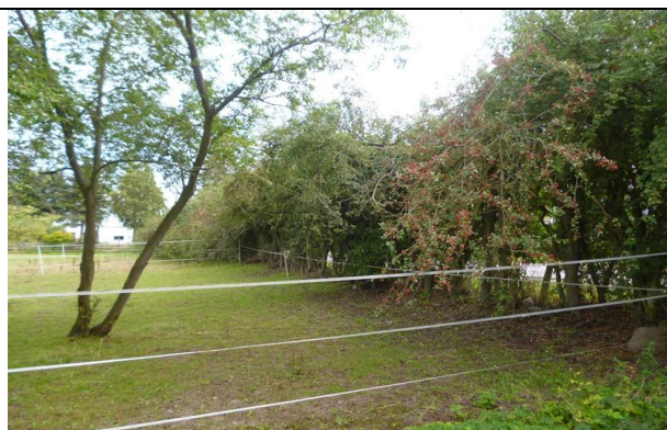
Bild 10: überalterte, einreihige Weißdorn-Hecke entlang der Wohnstraße Quastenberg mit durchschnittlicher Bedeutung als Nistplatz