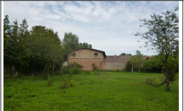
Bild 6: alte Scheune des ehem. Gutshofes im Norden; potenz. Nistplatz (Schwalben, Fledermäuse)