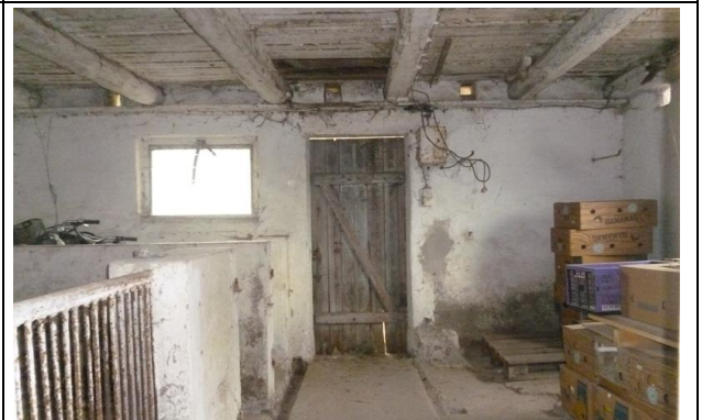
Bilder 7 und 8: altes massives Stallgebäude im Westteil des Plangebietes – geringe Eignung als Nisthabitat für Gebäudebrüter und Fledermäuse; Nischen im Mauerwerk sind lokal vorhanden