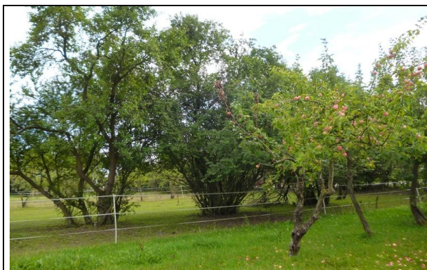
Bild 9: überaltertes Pflaumengebüsch im Zentralteil der Koppeln – Lebensraum für Grasmücken, Meisen, Sperlinge, Kleiber, Buntspecht