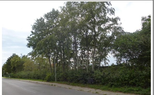
Bilder 3 und 4: lückige, überalterte Weißdorn-Hecken an der Wohnstraße und am Quastenberger Damm sowie mehrstämmiges Lindengebüsch (StD = 0,10/0,20 m); geringes Lebensraumpotenzial für Brutvögel