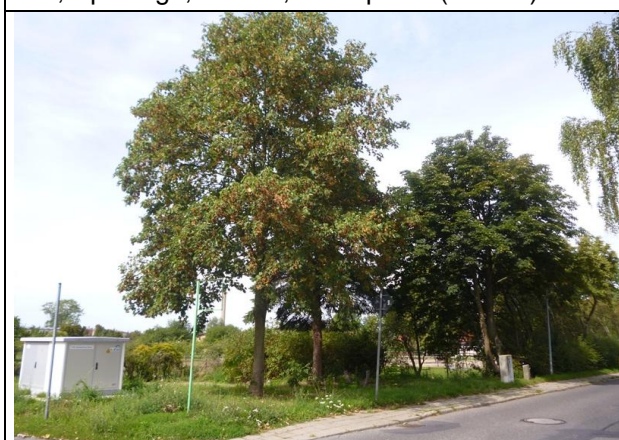
Bild 11: Baumbestand mittleren Alters (Spitzahorn, Blaufichte, Kastanie, StD = 0,30 - 0,45 m) an der Einmündung zum Quastenberger Damm – geringes Lebensraumpotenzial für Brutvögel