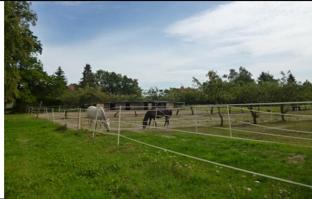
Bild 1: Blick nach Südosten über die Pferdekoppeln; mit schütterem Obstbaumbestand