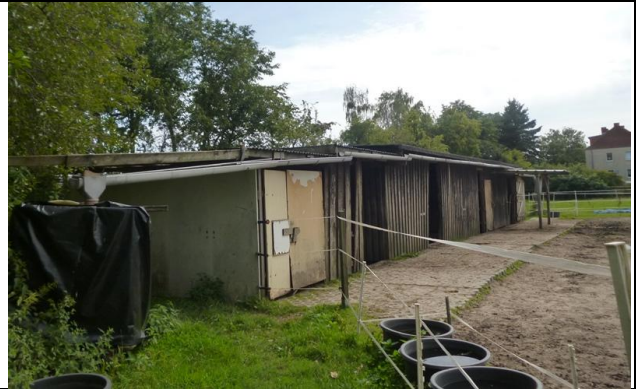
Bild 2: Unterstand für Pferde (Holz, Mauerwerk) - sporadische Nutzung durch Schwalben