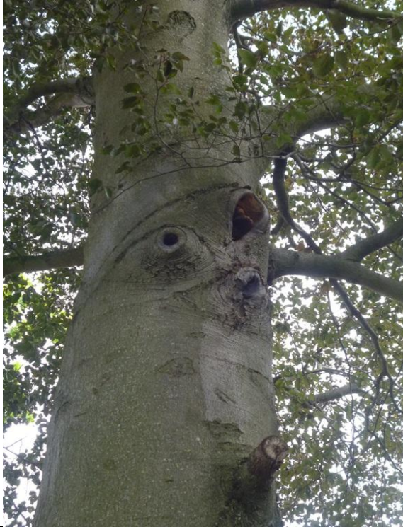
Bild 13: potenzieller Nistplatz für Fledermäuse in der Höhlung der alten Blutbuche (StD = 0,60 m) im Nordostteil des Areals – Fällung geplant

Vorhabens nur bedingt geeignete Strukturen (Höhlenbäume) vorhanden sind, kann die Fällung des Brutbaumes zu lokalen Revierverlusten führen. Durch Anbringen geeigneter Ersatzhabitate (Nistkästen) im zu erhaltenden Baumbestand kann die ökologische Funktionalität der Fortpflanzungsstätten im Gebiet im räumlichen Zusammenhang gewahrt werden (s. Punkt 3, Maßn. V 2).