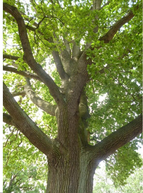
Bild 14: Erhaltenswerte alte Stieleiche mit nur leicht geschädigter Krone in ca. 2 m Abstand zur nördlichen Grundstücksgrenze