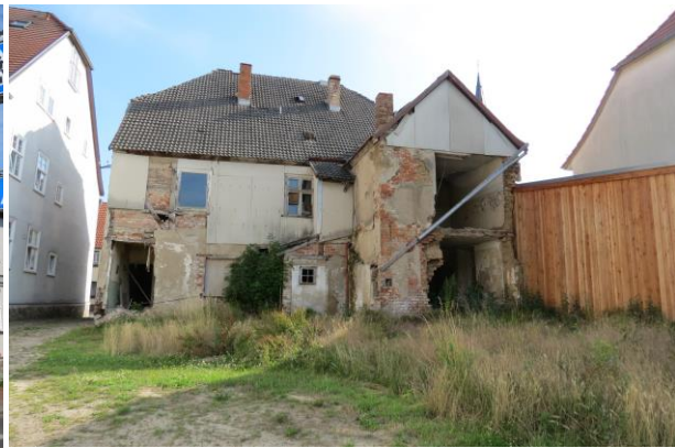
Marktstraße Nr. 10, Rückseite, Leerstand seit ca. 25 Jahren und sehr desolater Bauzustand