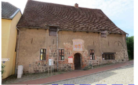
Sanierung Kurze Straße 1 und off. Nutzung inkl. Freianlage / Garten