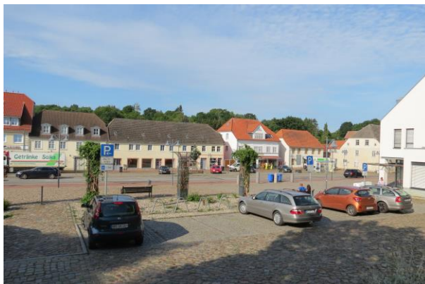
ergänzend zu gestaltende Freifläche an der Ostseite des Marktplatzes