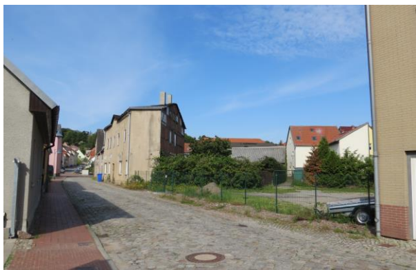
Neue Straße 3 und 5, Neubebauung anstreben, da als Eigenheimgrundstück geeignet