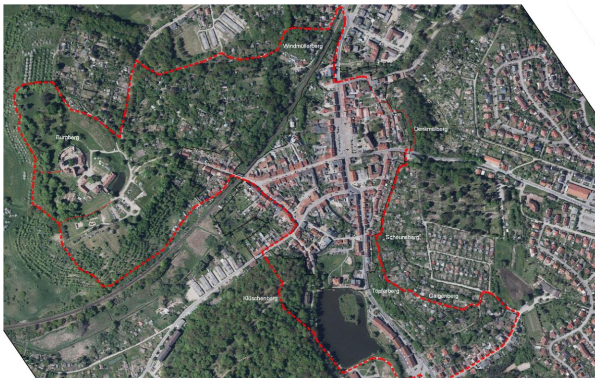
Altstadt mit Burganlage im Westen sowie EH-Siedlungen im Osten und der roten Linienführung des „7-Berge-Rundweges“

Zwischen der Altstadt und den neuen Baugebieten im Nordosten liegt ein Höhenrücken mit dem Denkmalberg, Scheunsberg, Töpferberg und Galgenberg. Durch Kleingartenanlagen und den städtischen Friedhof sind diese Flächen intensiv genutzt. Deshalb ist eine Verbesserung der Verbindung der Stadtgebiete funktional schwer umsetzbar. Der ausgeschilderte, sehr schmale Rundweg über die 7 Berge sowie vorhandenen Wege dienen ausschließlich der Erschließung der Gärten und sind kaum ausbaufähig. Somit bleibt die ebenfalls sehr steile und schmale Carl-Stolte-Straße die Hauptverbindung für alle Verkehrsteilnehmer.