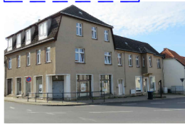
Sanierung und Wiedernutzbarmachung Mühlentochstraße 2