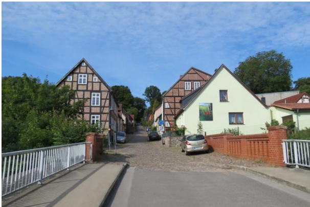
Burgstraße, von der Eisenbahnbrücke aus gesehen