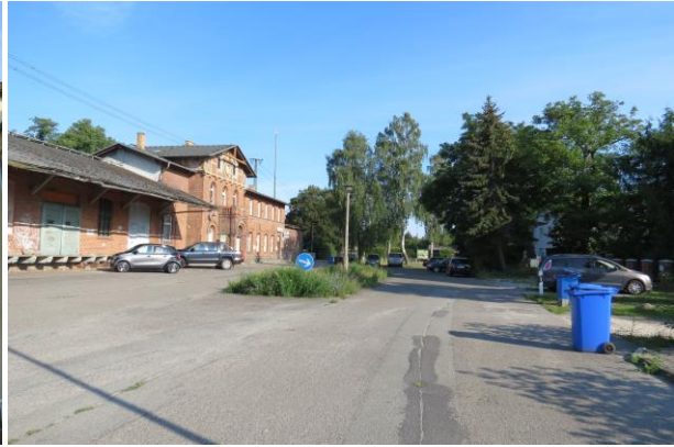
Auf dem Bahnhofsvorplatz fehlt jede Zuordnung für die verschiedenen Verkehrsarten