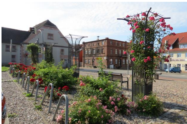
Marktsüdseite, Blick auf zwei Markt- Eckgebäude mit Sanierungsbedarf