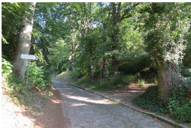
Zufahrt zum Burggelände über den Weinbergsweg