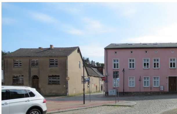
Bachstraße 19, Neubebauung nach Abbruch zwingend