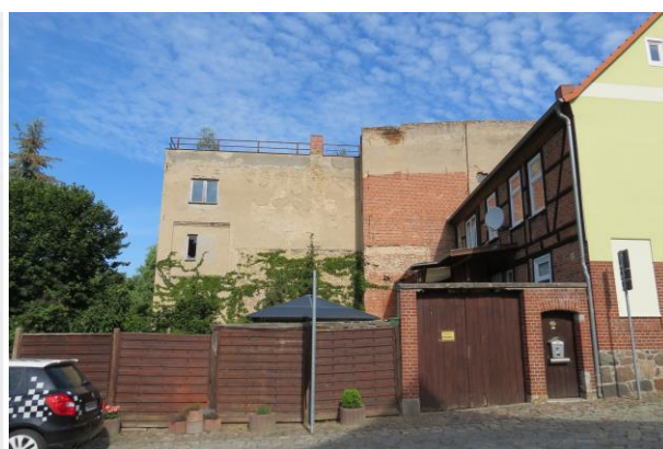
Mühlensstr. Nr. 14, stark sanierungs- bedürftiges Hauptgebäude und sehr massive, hohe Nebengebäude im Stadt- bild, daher ggf. Abbruch oder Teilabbruch notwendig