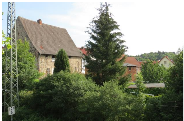
Rückseite und Garten vom „Alten Hospital“