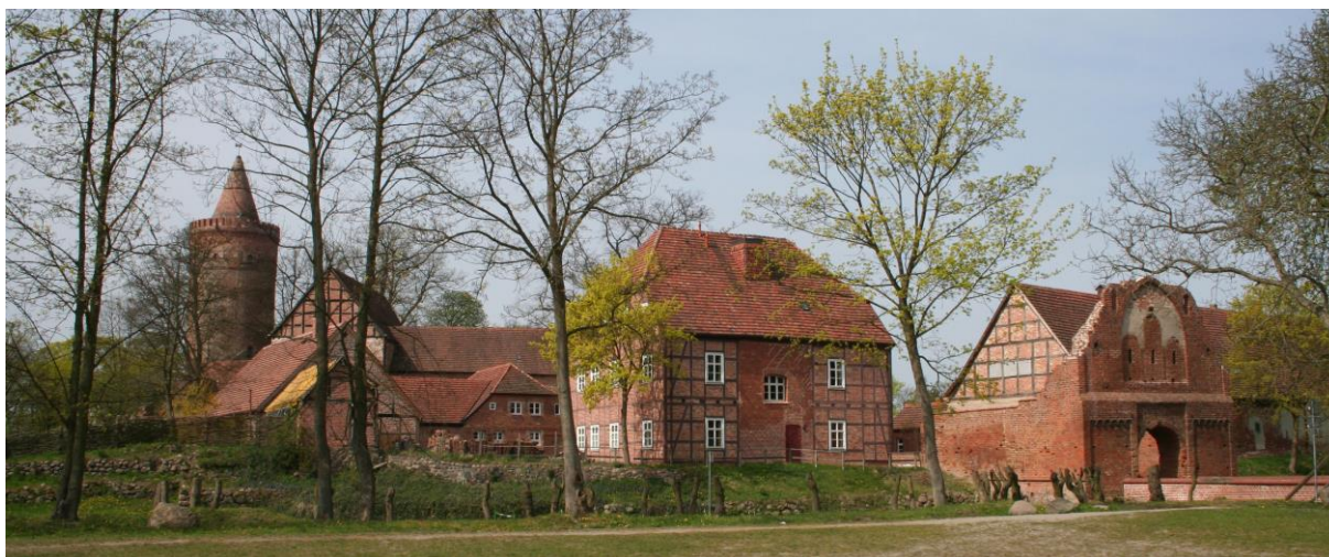
Panorama der Burganlage aus dem Jahr 2007

Mit diesem Rahmenplanerischen Entwicklungskonzept werden die grundsätzlichen Zielstellungen beschrieben. Sie dienen zur Begründung der Verlängerung der Sanierungssatzung.