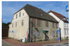
Sanierung oder Ersatzneubau für das Wohn- und Geschäftshaus Marktstr. 10