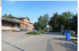
Neugestaltung und Erhöhung der Verkehrssicherheit des Weges zum Bahnhof