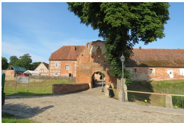
Neu gestalteter Zugang zum Burggelände