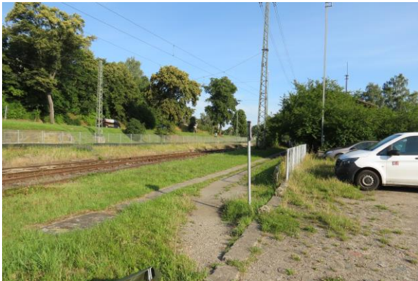
Der illegale, gesperrte Gleiszugang vor dem Bahnhofsgebäude wird als Trampelpfad benutzt