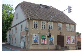
Sanierung und Neubau Verwaltungszentrum mit Freianlage und Haltestelle