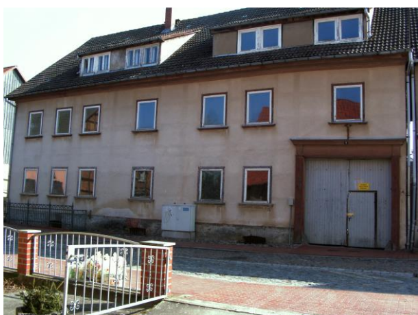
Lange Straße Nr. 9, ehemalige Brauerei Straßenseite