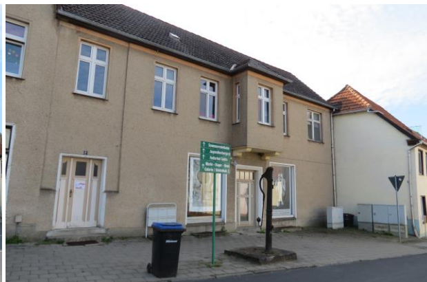
zu gestaltende Nebenanlage der Mühlensstraße/ Ecke Marktstraße, vorzugsweise in Verbindung mit EG-Nutzung