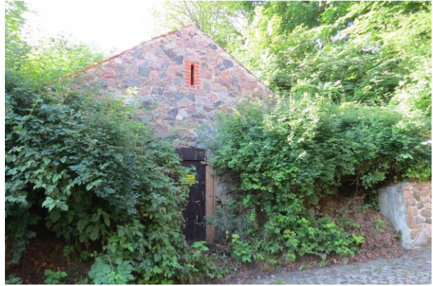
Gesperrter Eiskeller in der Burgstraße