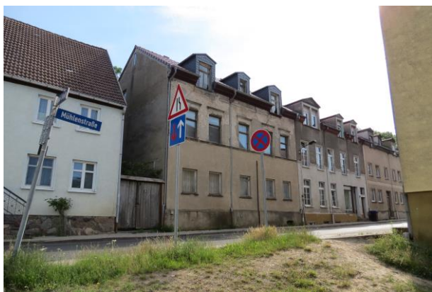
Mühlensstraße Nr. 19, 21 und 23