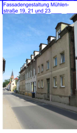
Fassadengestaltung Mühlentochstraße 19, 21 und 23