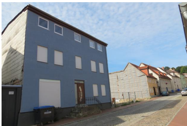
Kurze Straße Nr. 8 und 9, Neubebauung zwingend