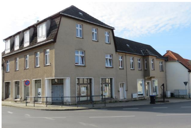
Mühlensstraße 2, ehemaliges Wohn- und Geschäftshaus