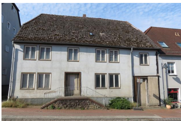
Marktstraße Nr. 14, Leerstand seit vielen Jahren