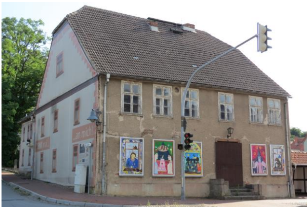
Denkmalgeschützte Marktstraße Nr. 7, Marktplatzecke