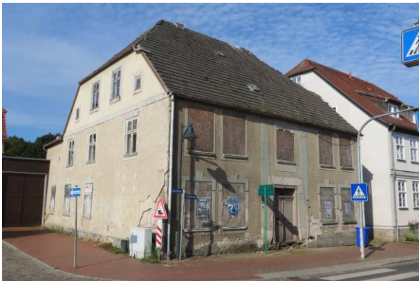
Denkmalgeschützte Marktstraße Nr. 10, Marktplatzecke