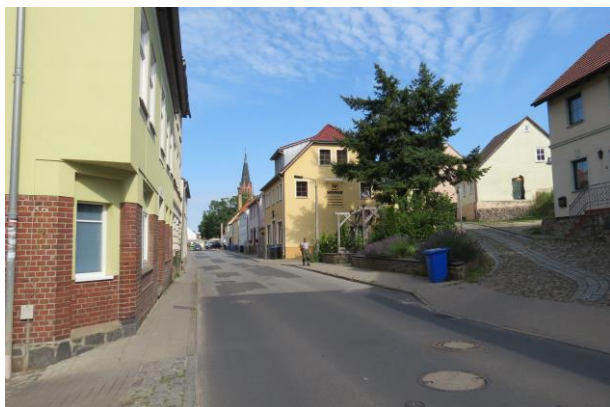
Fußweg in der Mühlenstraße, schlecht zu belaufen