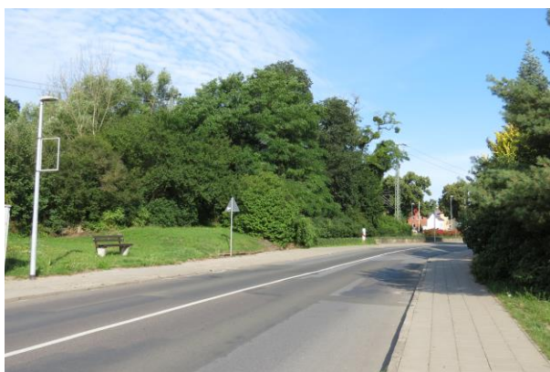
Der Auftakt der Altstadt als öffentliche Grünfläche bis zu den Bahngleisen sollte aufgewertet werden