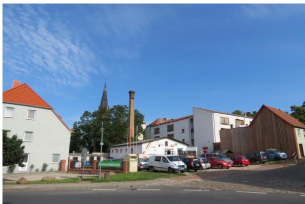
Ecke Marktstraße / Am Berge Neubebauung wünschenswert