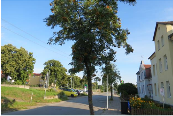
Sehr schmaler Gehweg Richtung Bahnhof und keine sichere Führung für Radfahrer