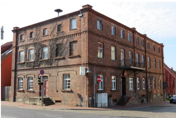
Markt Nr. 12, Leerstand bis auf Apotheke im EG