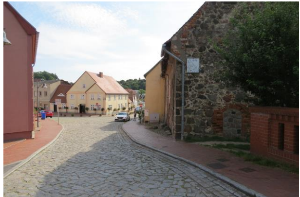
Übergang zur Kurzen Straße (Ziegenmarkt)