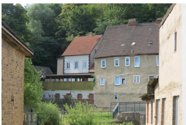
Klüschenbergstr. Nr. 9, frei stehendes, stark sanierungsbedürftiges Wohnhaus, das im Stadtbild sehr präsent ist