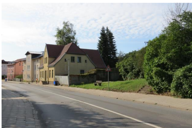
Der Übergang zur Bahnhofstraße ist dagegen durch schmale Gehwege gekennzeichnet