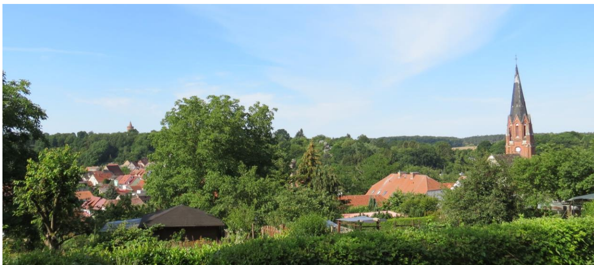
Blick auf Altstadt und Burg vom Scheunsberg aus ( 7-Berge-Rundweg oberhalb der Grabenstraße )

Die besondere Lage der Altstadt „zwischen den 7 Bergen“ sollte stärker in den Focus gerückt werden. Ein ausgeschildeter Rundweg ist bereits vorhanden. Dieser Weg kann teilweise weiter ausgebaut oder um bestimmte Verbindungswege ergänzt werden.