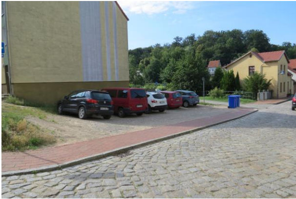
Ehemalige Mühlenstr. Nr.18 mit Nutzung als Parkplatz, Neugestaltung der Freifläche