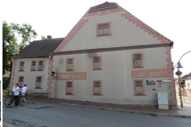
geplante Umnutzung zum Verwaltungsgebäude