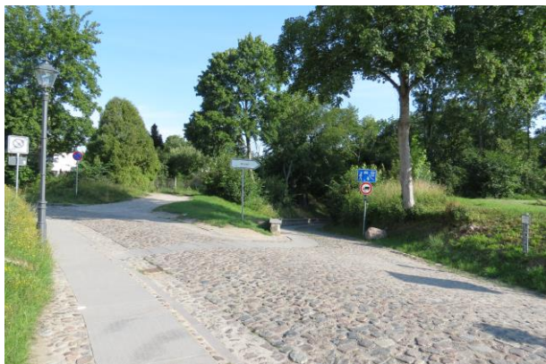
Übergang von der Burg zur Burgstraße