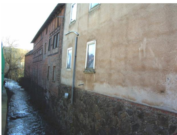
Lange Straße Nr. 9, Gebäude entlang des Lindebaches