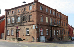
Sanierung oder Ersatzneubau für das Wohn- und Geschäftshaus Markt 12