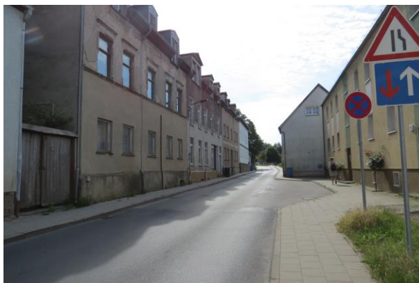
Fußweg Mühlenstraße mit Einschränkungen der Breite