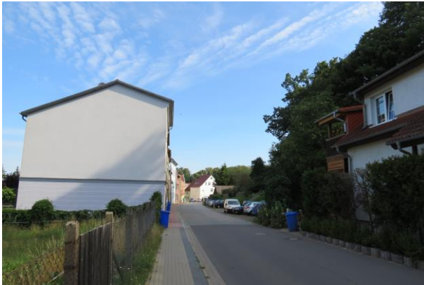
Altstadtrand Sabeler Weg Nr. 14 und 15