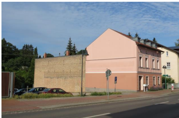
Baulücke nach Abbruch des Wohnhauses Marktstr. Nr. 18