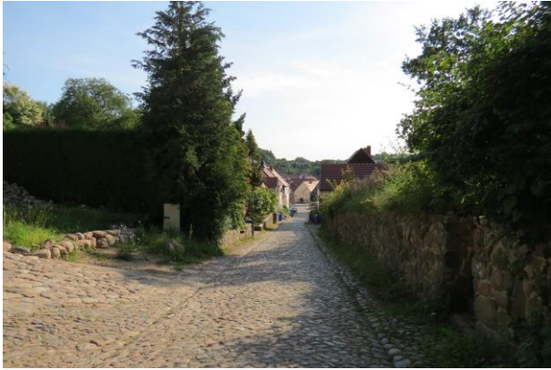
Denkmalgeschützter Bereich der Burgstraße