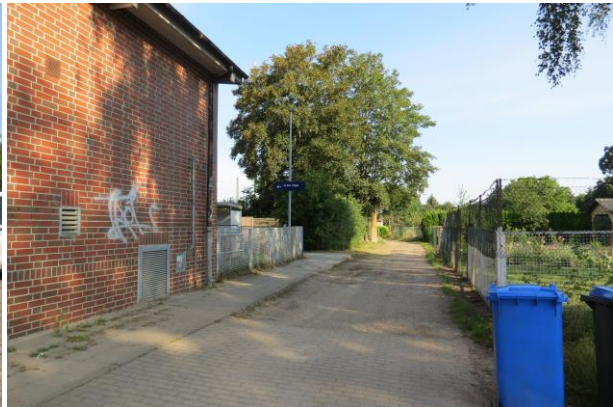
Der reguläre, ausgeschilderte Zugang zum Bahnsteig, ganz an Ende des Bahnhofsgebäudes, ist umwegig und wenig einladend