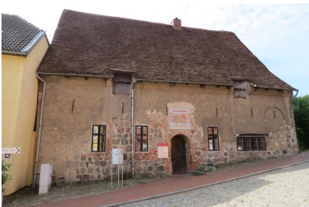
Das denkmalgeschützte „Alten Hospital“ Kurze Straße Nr. 1