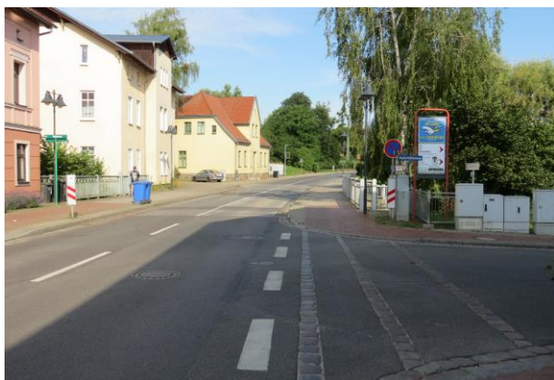
Bis zur Brücke über den Lindebach ist die sanierte Marktstraße mit breiten Nebenanlagen als Fuß- und Radweg gestaltet, dafür wurde bewusst auf das Pflanzen von Straßenbäumen verzichtet