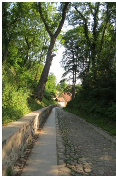
Laufband in der Burgstraße Richtung Altstadt